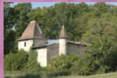
Chateau du Vellein