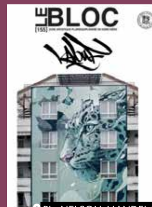
PL. NELSON MANDELA

De projets collaboratifs aux oeuvres en solo, en passant par des expérimentations (anamorphose, mapping vidéo), il gagne en maturité dans l'exécution de peintures murales aux dimensions monumentales.